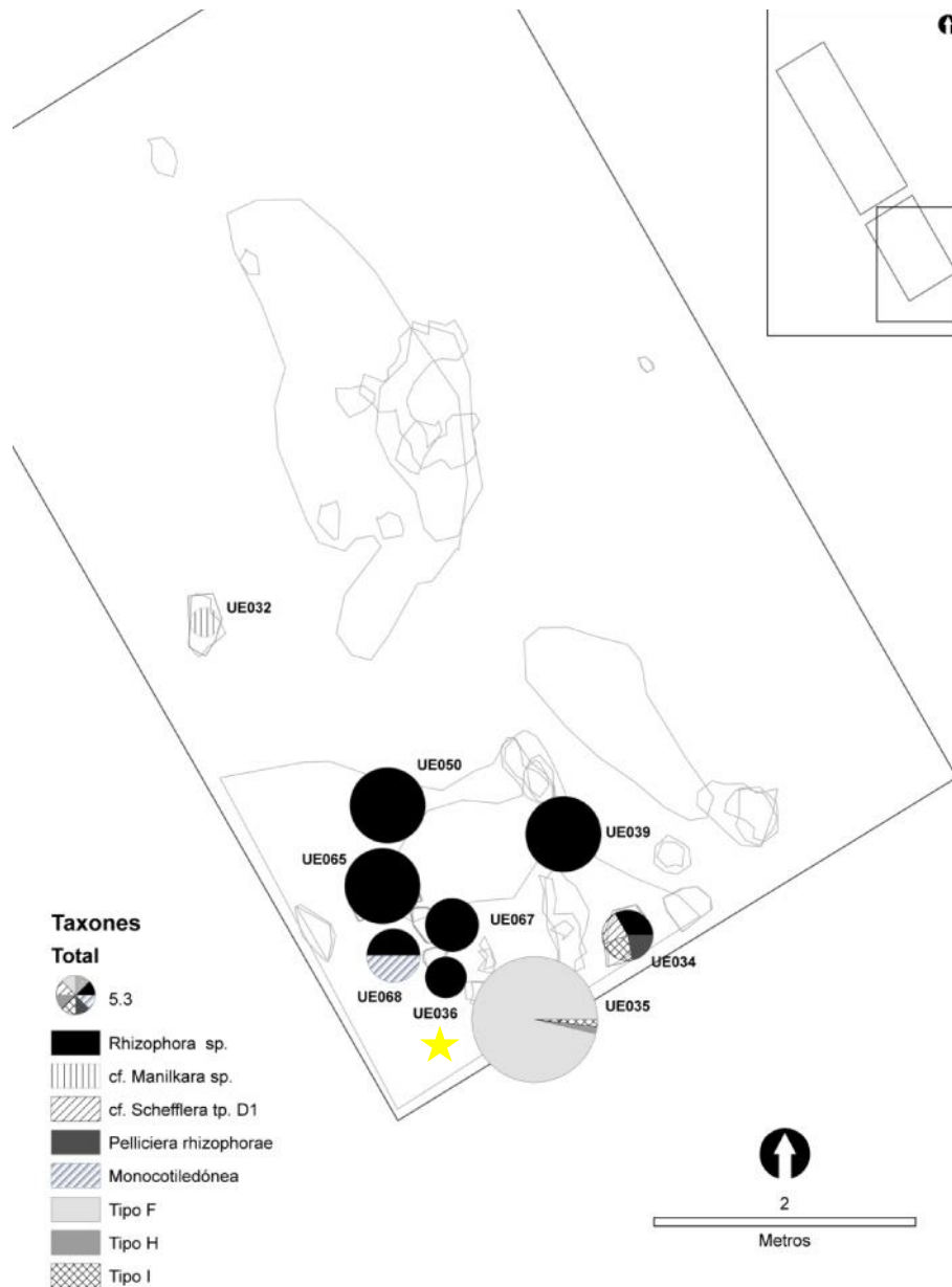
Fig. 1. Plano de la Operación 1 con la distribución espacial de las unidades estratigráficas y la identificación taxonómica de las muestras.

La muestra de sedimento con número de registro 2236 fue recogida de forma manual en la Operación 1 durante la campaña de 2008. Esta muestra fue recuperada de la UE036 situada en la unidad de registro E1 (Fig. 1). Esta unidad estratigráfica se corresponde con el relleno de una estructura negativa similar a un agujero de poste. Teniendo en cuenta, la monoespecificidad de la muestra, sus atributos dendrológicos y su contexto de procedencia, estos carbones probablemente se corresponden con los restos de un horcón de mangle ( Rhizophora sp.) preservado por carbonización.