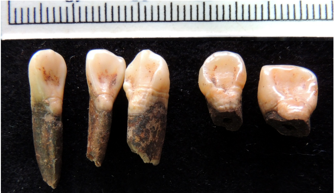
Cíngulo en incisivo central superior.