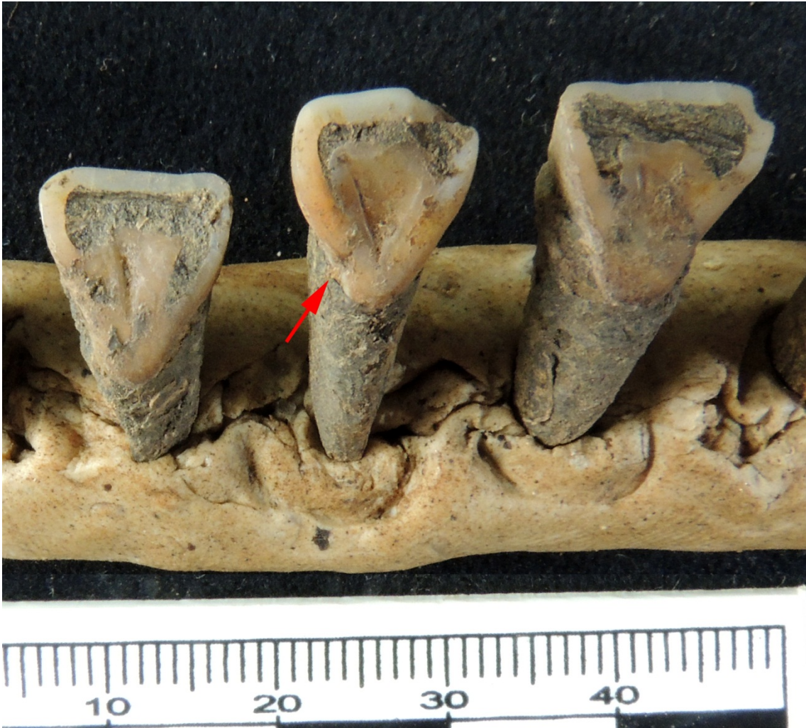
Varios dientes tenían sarro en la zona del cuello y en la unión cemento-esmalte.