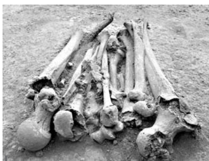
Figura 6 – Paquete secundario E2, nivel 6, tola 7, Japoto

depósito E2. Dentro de este depósito 13 , se encontró una patella derecha pero su morfología era muy distinta a la del paquete E2. Además, la presencia de las tres primeras vértebras cervicales 14 en conexión anatómica nos permitió concluir que este paquete representa otro individuo de sexo indeterminado.