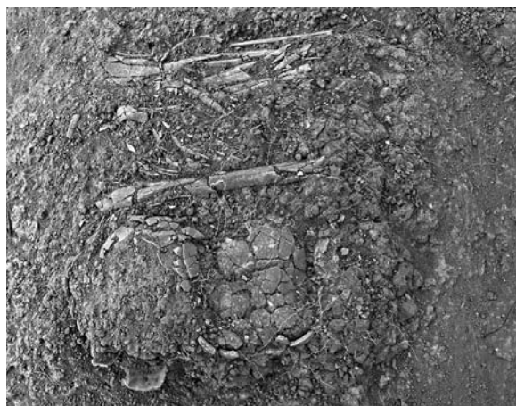
Figura 2 – Paquete secundario de la zona 2 nivel 1, tola 7, Japoto

La zona 2 reveló la presencia de tres cráneos pertenecientes a dos adultos y un niño en un paquete de 75 cm de largo por 60 cm de ancho. De nuevo los cráneos y los huesos largos 8 aparecieron en el primer nivel mientras los restos de la columna y las extremidades se hallaron en los últimos niveles (fig. 2). Los dos cráneos de adulto aparecieron uno mirando al este mientras el segundo mirando al oeste. El cráneo del niño se encontró muy quebrado y su posición no pudo ser determinada. Una aguja de cobre y varias cuentas de concha estaban en el primer nivel con los cráneos.