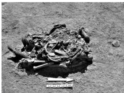
Figura 4 – Paquete secundario E2, nivel 2, tola 7, Japoto