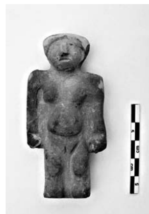
Figura 3 – Estatua de mujer embarazada, tola 7 E1, nivel 3, Japoto

Mediante el análisis del paquete secundario E2 se concluyó que los restos óseos pertenecen a un solo individuo adulto de sexo masculino. El esqueleto es casi completo a excepción de la cabeza. No se pudo calcular la estatura, considerando el estado de preservación de los huesos. La edad se estimo entre 35 y 45 años. Las vértebras torácicas y lumbares presentan evidencias de osteofitis que se pueden relacionar con una actividad especial (transporte de carga) más que con la edad. Otro paquete llevando algunos huesos (E3) fue excavado a 53 cm al sureste del